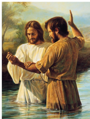
Jesús fue bautizado