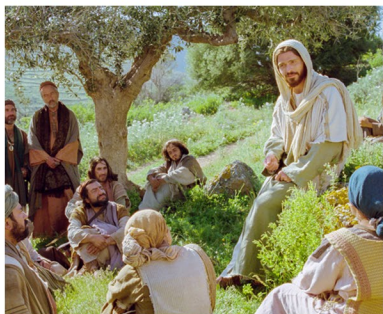
Jesús compartió el evangelio